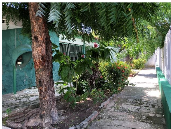
Foto02: espaço aberto na entrada da escola, com canteiros e pavimentação deteriorados.