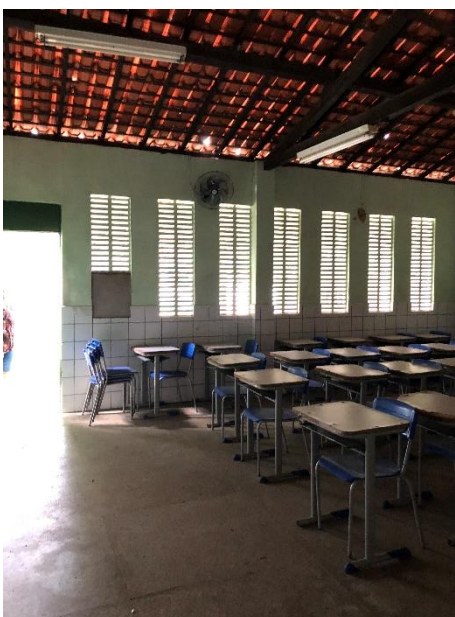
Foto 10: salas de aula sem climatização e com circuitos elétricos defeituosos.