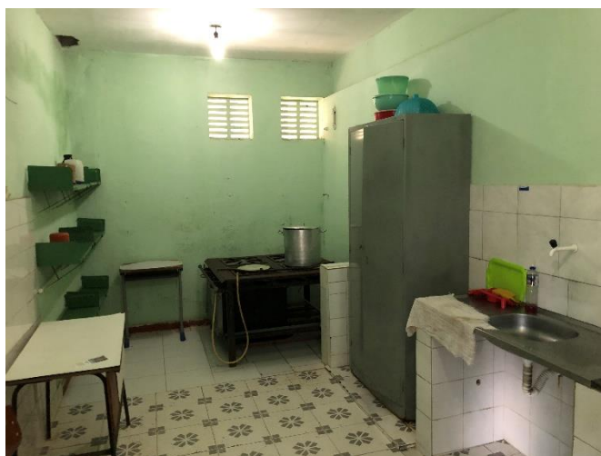
Foto 14: cantina com paredes sujas e com infiltrações, sem local adequado para armazenamento de utensílios.