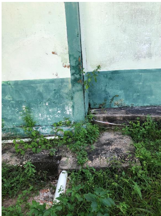
Foto 18: calçadas externas estreitas e deterioradas, tubulação de esgoto danificada.