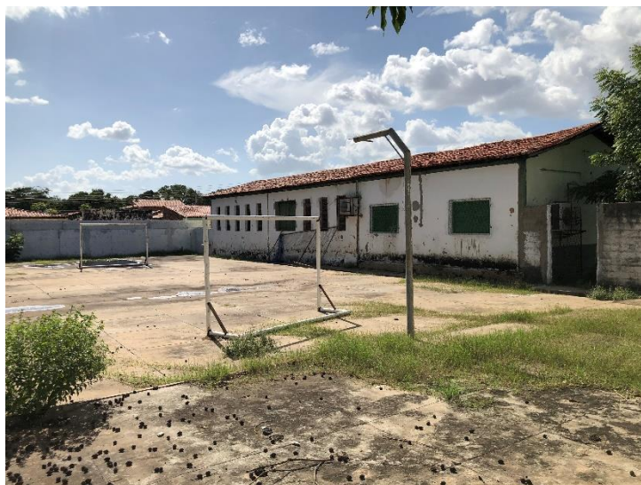
Foto 19: quadra de esportes descoberta em estado precário, sem demarcação das linhas, além de contar com um mato envolto, com pavimento inadequado, deteriorado, acumulando água.