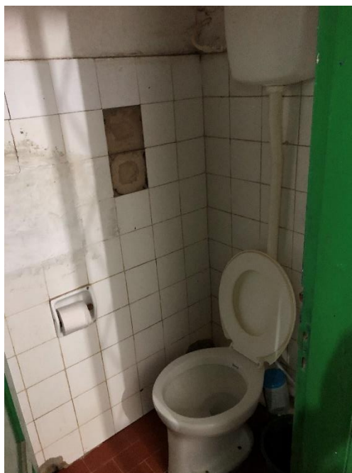
Foto 16: banheiro da sala dos professores com problemas hidrossanitários.