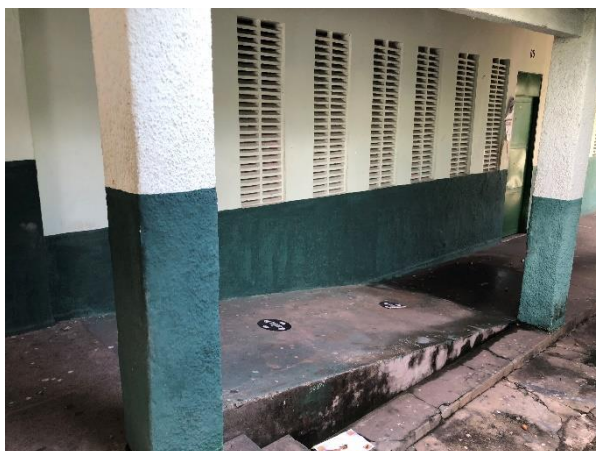
Foto 06: rampas sem corrimão, com inclinação inadequada para uso de cadeirantes.