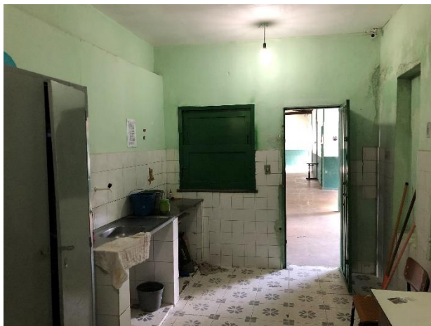
Foto 15: cantina com paredes sujas e com infiltrações, sem local adequado para armazenamento de utensílios.