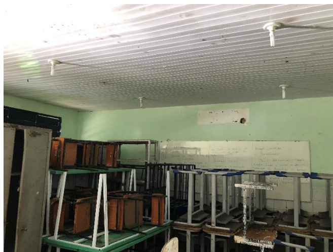
Foto 07: salas de aula com paredes sujas e com infiltrações, forro e parte elétrica deterioradas.