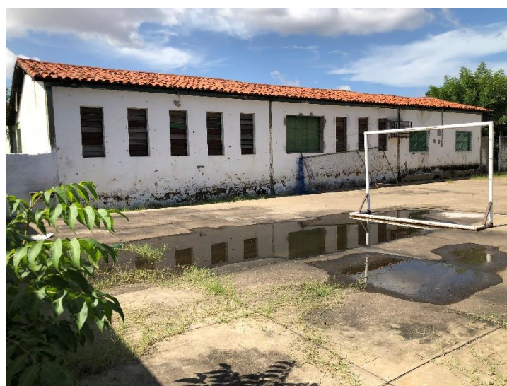
Foto 20: quadra de esportes descoberta em estado precário, sem demarcação das linhas, além de contar com um mato envolto, com pavimento inadequado, deteriorado, acumulando água.