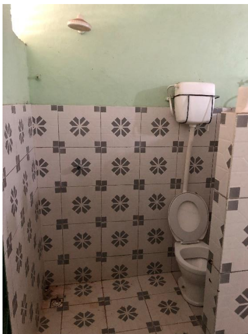
Foto 12: banheiros com problemas em peças sanitárias e com infiltrações.