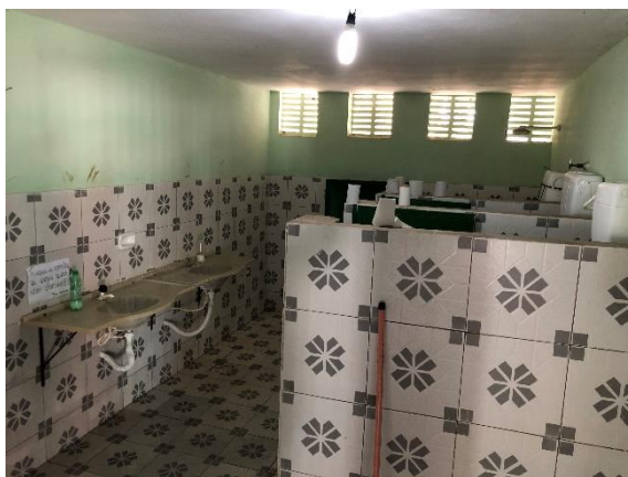
Foto 11: banheiros com problemas em peças sanitárias e com infiltrações.