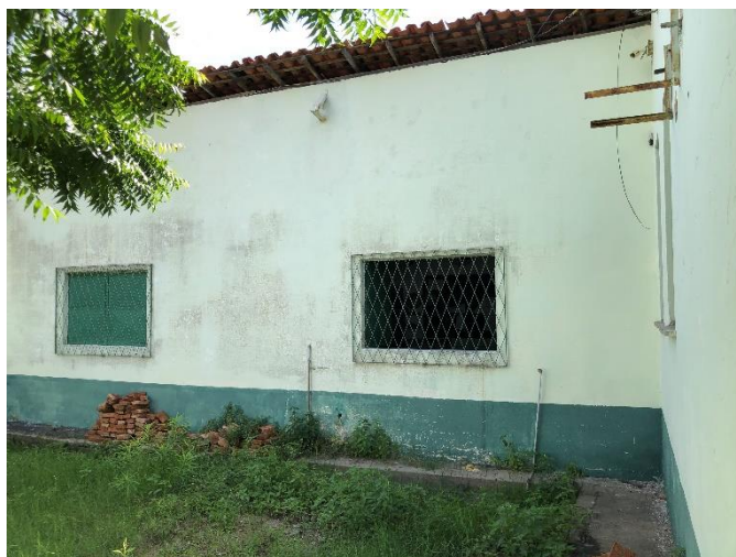
Foto 03: calçadas estreitas e deterioradas em todo o perímetro da edificação.