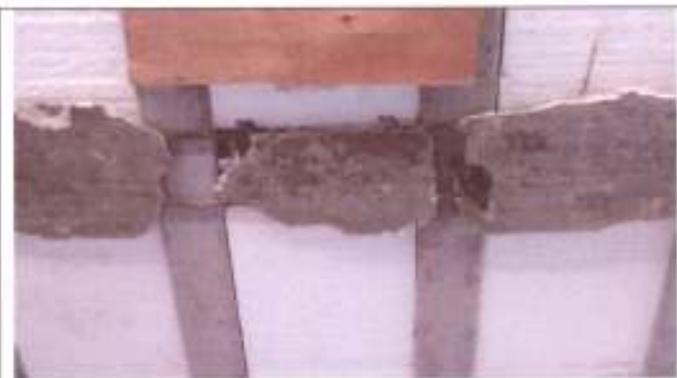
Armadura exposta nas vigas dos vestiários