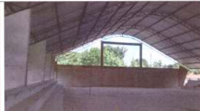
Vista interna da quadra