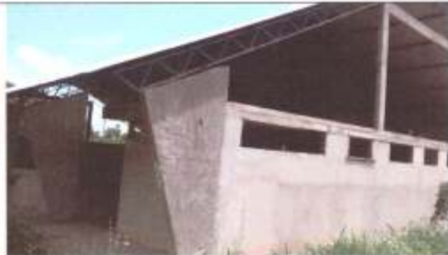
Detalhe lateral da quadra