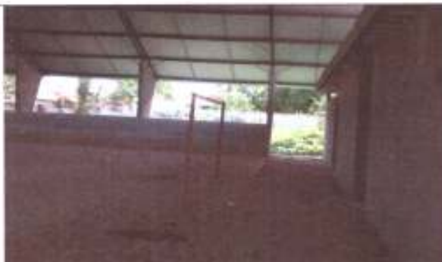
Paredes sem revestimento cerâmico