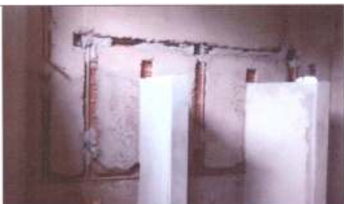
Box dos vestiários