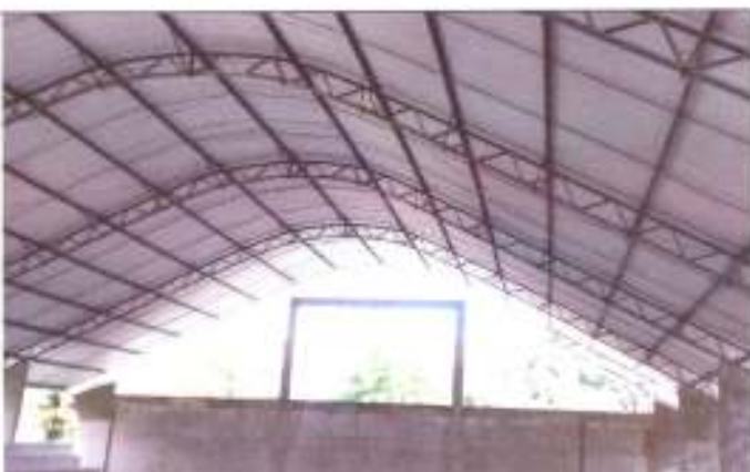
Detalhe da cobertura metálica