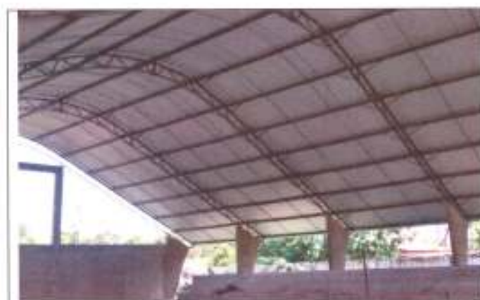
Estrutura da cobertura metálica não pintada