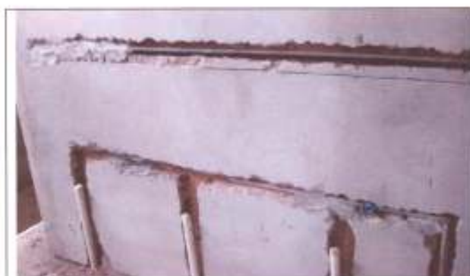
Instalações hidráulicas parcialmente executadas