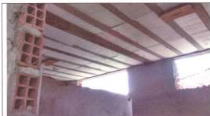
Lajes dos vestiários executadas – sem revestimento