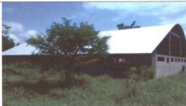
Vista geral da quadra