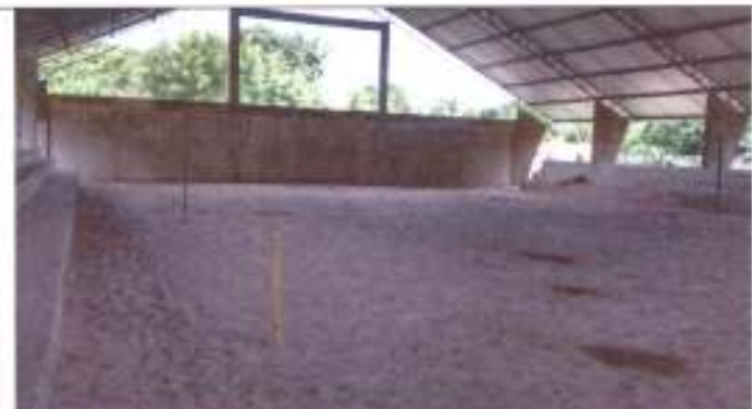
Sem piso na quadra