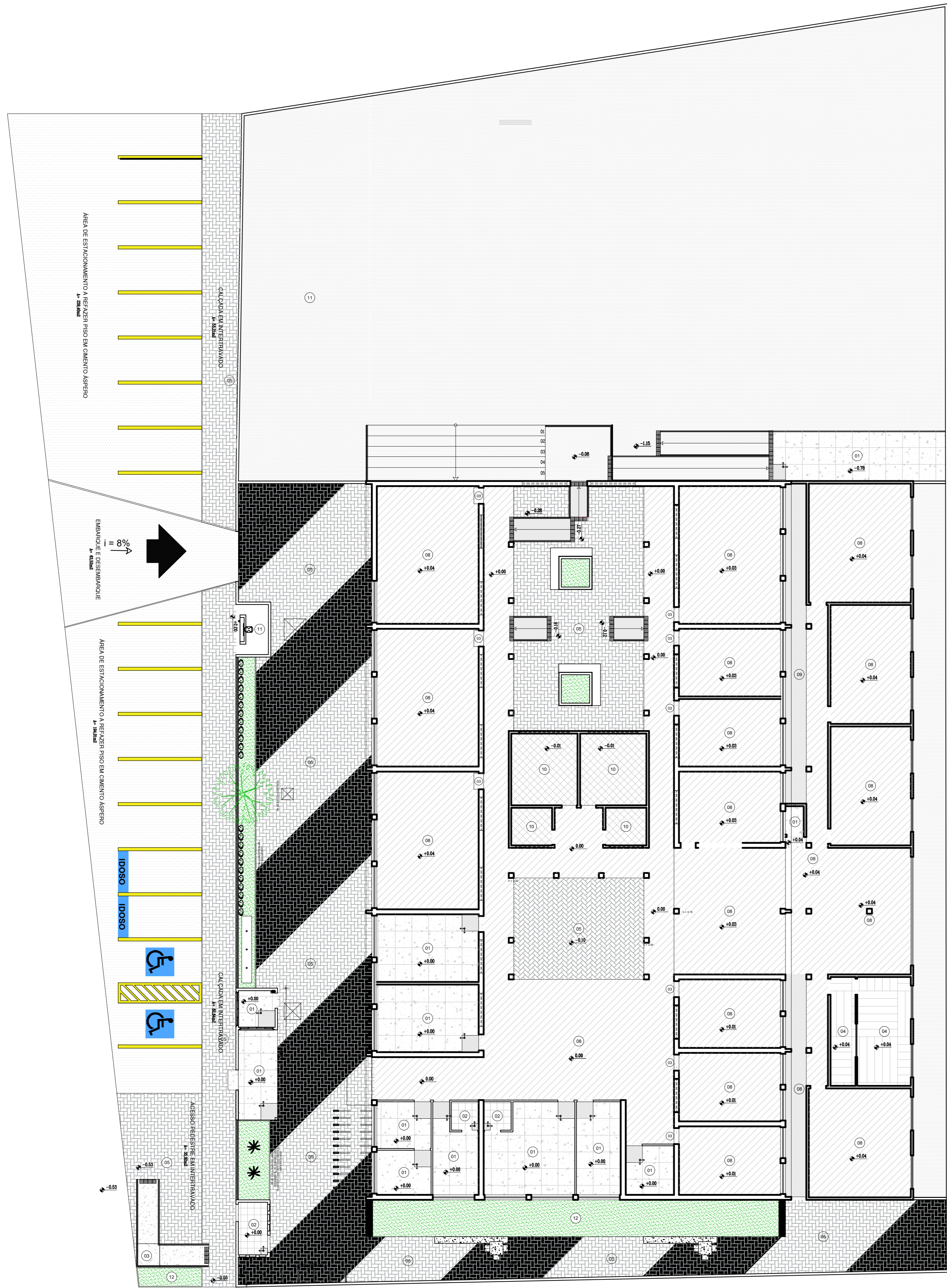
13 PLANTA DE PISO ESCALA: 1/100